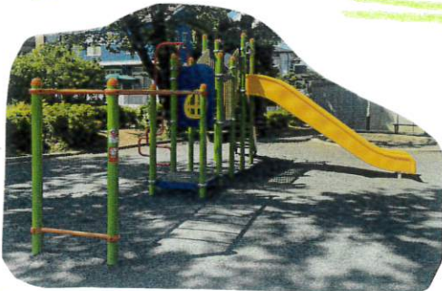
うまい付のすべり台